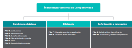
Gráfico 1. Estructura del Índice Departamental de Competitividad 2016.